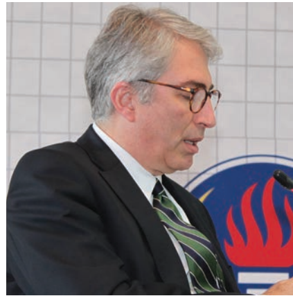
Ben 12 Eylül Orta Doğu Teknik Üniversitesi'nin Öğrenci Temsilcileri Konseyinin bir üyesiydim